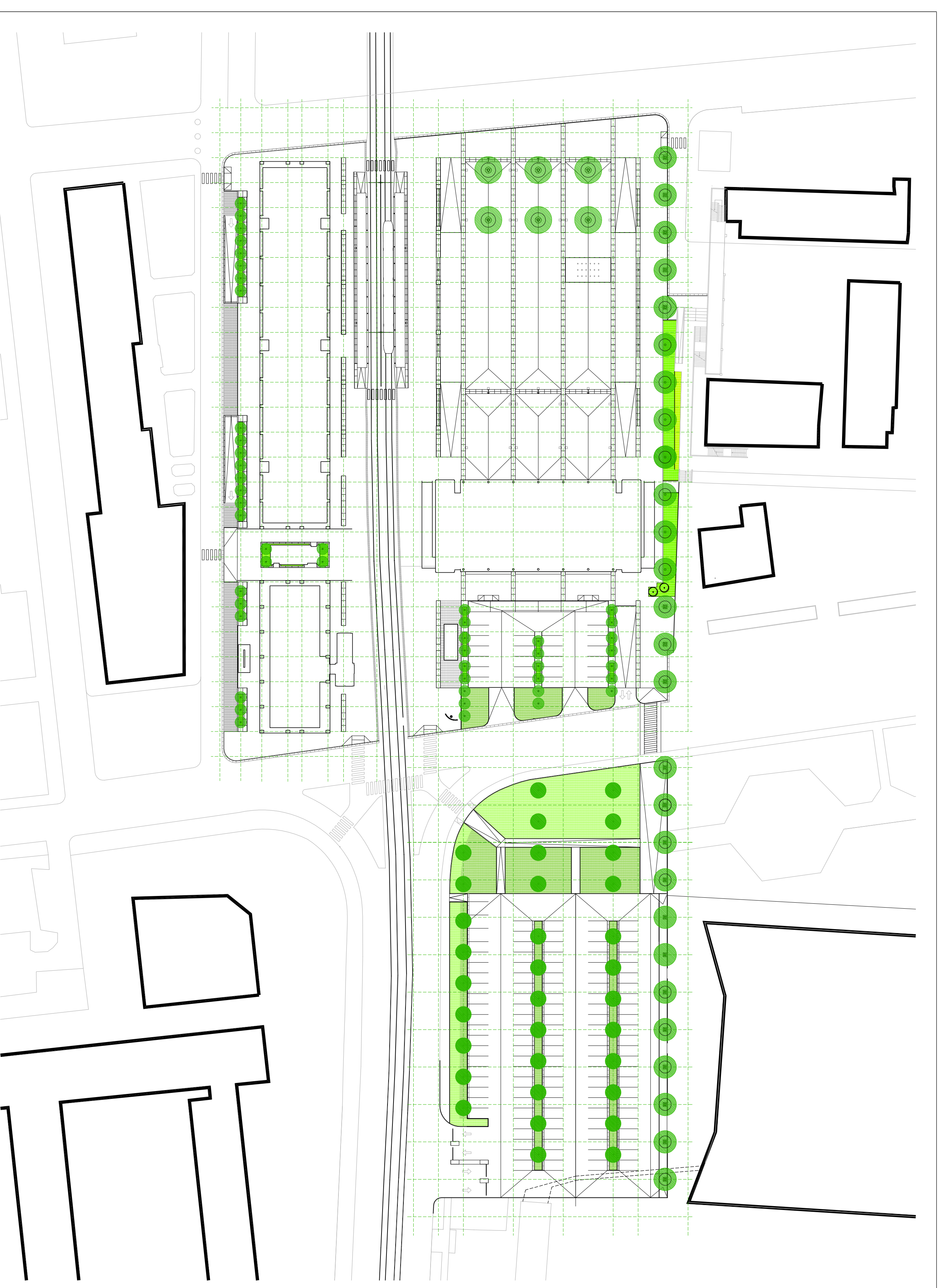
OPERE A VERDE